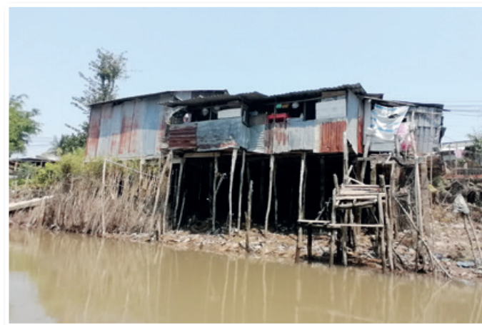
Reka Mekong, gradbeni presežek

Ta avantura se nama je zdela kar zanimiva, zato sva se za popoldne na obali kar zmenila z eno žensko, da naju popelje še v kakšne stranske rokave reke. Klicala sva jo kar „U-lala“. Njen čolniček je imel namreč dolg propeler, ki je vsake toliko zajel kakšno plastično folijo, ki jo je nama z obračanjem motorja servirala naprej, da sva jo snela in vrgla v čoln. Pri tem je vedno vzkliknila u-lala, kar je bila vsa njena vsebina iz anglo-saksonskega slovarja. Vozili smo se po neturističnih rokavih reke, kjer so ljudje prali oblačila v reki, se kopal, zbirali rastlinje in počeli vse kot običajno. Podoba stavb pa je bila dokaj žalostna, vseeno pa bi težko govorili o revščini, saj je praktično pred vsako bajto stal vietnamski statusni simbol – motor. Ulala naju je po nekaj urah pripeljala nazaj, vmes pa smo naleteli še na