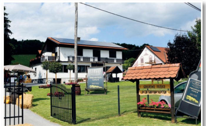
Hiša vin Kokol - Ciglence 20, Sp. Duplek, Duplek

Ministrstvo za kmetijstvo, gozdarstvo in prehrano ter Mreža za podeželje sta skupaj s kmetijami in nosilci projektov organizirala dneve odprtih vrat od 22. do 30. 8. 2020, v katerem so se predstavile uspešne zgodbe slovenskega podeželja, ki so bile podprte z evropskimi sredstvi. Z organizacijo dni odprtih vrat so želeli poudariti pomen lokalne pridelave hrane, ohranjanja podeželske krajine ter preživljanja aktivnega prostega časa in dopustov na podeželju. Vključilo se je 22 kmetij in podeželskih projektov iz vse Slovenije, obiskovalci spletne strani programa razvoja podeželja pa so oddali glas podprtem kandidatom, ki so jim bili všeč. V času glasovanja od 17. do 30. 8. so prejeli 4204 glasov, od tega je Hiša vin Kokol prejela 1624