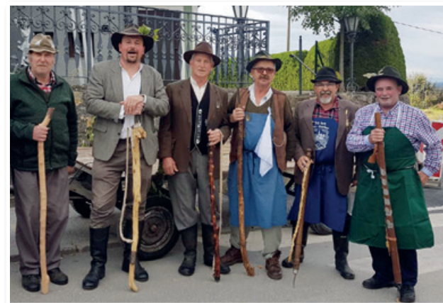
S prvega srečanja Ovtarjev ...

Ovtarjev zdaj že dolgo ni več, se pa ovtarstvo ohranja kot običaj. Tako so ovtarji, ki ohranjajo to izročilo, lani imeli 1. srečanje slovenskih ovtarjev.