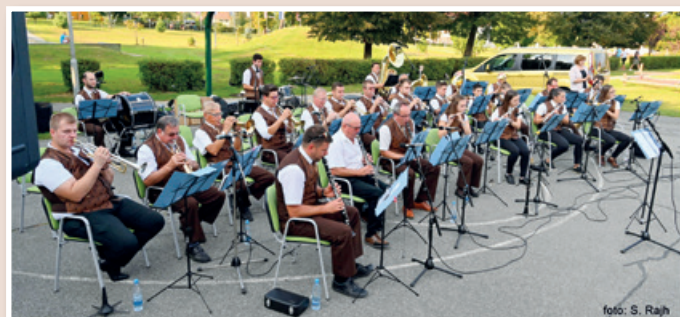
MOL, foto: Slavek Rajh