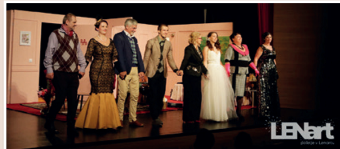
Hotel Opera