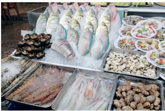
Lokalna ponudba morske hrane