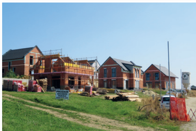
Hiše v novi soseski Trojica jug zelo hitro gradijo.

Tako bo Občina Sveta Trojica konec septembra v sodelovanju z Zavodom za turizem Sveta Trojica pripravila na Trojiškem trgu v središču naselja Trilogijo ob jezeru . Gre za tri koncerte vrhunskih izvajalcev. 25. septembra bo koncert znane slovenske pevke Nine Pušlar , 26. septembra bo koncert slovitiga slovenskega zbora a capella Perpetuum Jazzile , ki izvaja zlasti pop in jazz, 27. septembra pa bo na Trojiškem trgu koncertiral mariborski violončelist in član slovitega 2Cellos Luka Šulić . Zaradi epidemije se na nobenem koncertu ne bo smelo zbrati več kot 500 ljudi. Organizatorji so zato dali v prodajo za vsak koncert 450 vstopnic, saj bo 50 ljudi sodelovalo pri organizaciji in tehnični izvedbi koncertov. Kako publika v teh časih potrebuje takšne koncerte in druge prireditve, kaže tudi dejstvo, da so tretjino vstopnic prodali že prvi dan, ko so jih dali v prodajo.