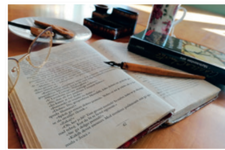
Jutro z Agatho Christie

V jesenskih dneh je še toliko za postoriti. Spravljamo ozimnico, iz vinogradov se slišijo vesele pesmi beračev, pa vendar, cenjeni naši