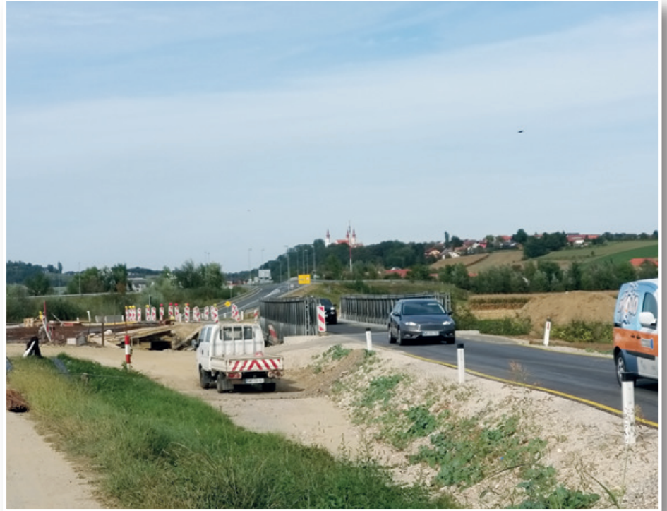
Na državni cesti Lenart–Ptuj proti Gočovi v trojiški občini poteka gradnja novega mostu čez reko Pesnico, saj starega ni bilo mogoče sanirati. Ostali so le deli temeljev in stebrov. Za zagotovitev prometa so morali postaviti začasni nadomestni most z izmenjujočim enosmernim prometom.