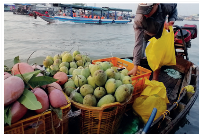
Tržnica na reki Mekong