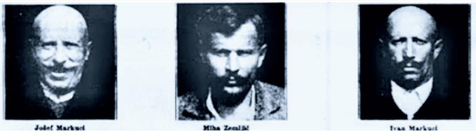
Portreti oproščenih dne 29. 8. 1935. Tedenske slike časopisa Domovina.