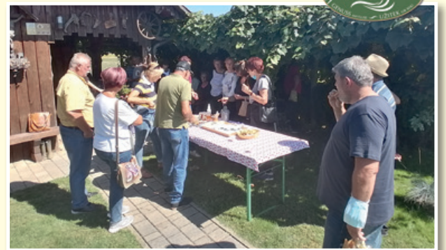
Degustacija pri čebelarstvu Tigeli, Verzej