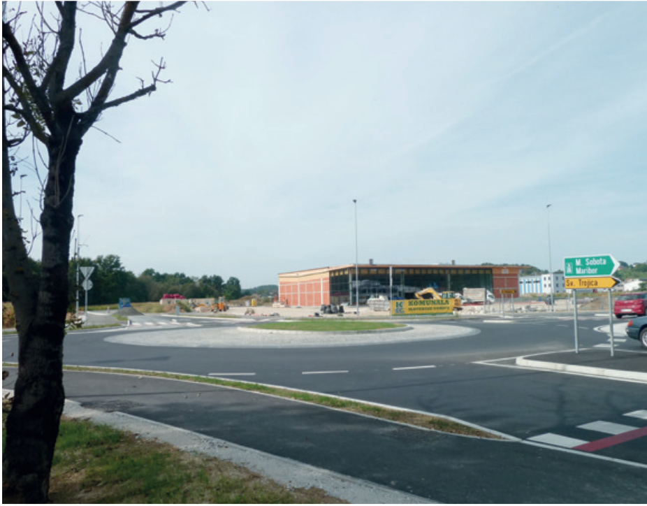
Celovita posodobitev glavne prometnice skozi Lenart proti Gornji Radgoni je dopolnjena z izgradnjo krožišča pri odcepu za Sveto Trojico in del nove poslovno-industrijske cone, kjer poteka gradnja trgovine Spar. Naložba, ki jo je zagotovila Direkcija za infrastrukturo RS, je »težka« okrog četrta milijona evrov.