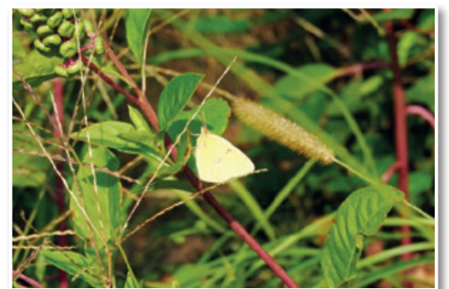
Ameriška barvilnica, rastoča na degradiranem gozdnem robu, kjer je prostor za počitek našel metulj

oglašanja. Te so skobec, kanja, brglez, velika sinica, šoja in še siva vrana.