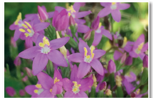
Rožnati cvetovi navadne tavzentrože, ki so jo babice rade nabirale in sušile za zeliščni poparek z zdravilnimi učinki