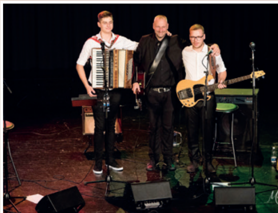
Waldhütter & sin trio