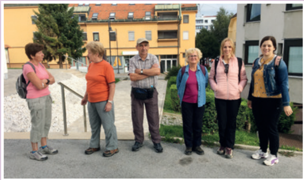
Pohod ob prireditvi TVU