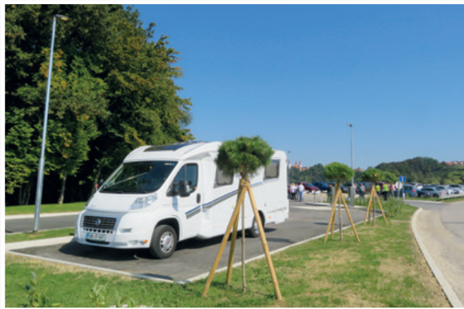
Na postajališču za avtodome ob južni vpadnici v Sveto Trojico so zgradili postajališče za dva avtodoma, po potrebi pa ga lahko še razširijo.

Ker bo v novi soseski Trojica jug veliko otrok in mladih, pa tudi sicer pristojni na občini že razmišljajo o izgradnji novega vrta.