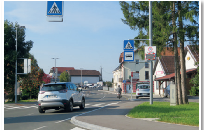
K varnosti v cestnem prometu v Cerkvenjaku prispeva tudi lepo urejena prometna signalizacija.

Lani se je na območju Občine Cerkvenjak krepko povečalo tudi število prometnih ne-