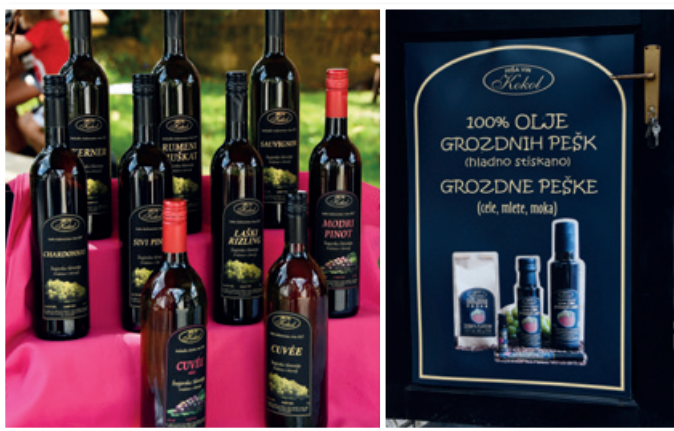
Vina in grozdne peške

predavanje na temo vina in grozdnih pešk ter degustacija vin in izdelkov iz grozdnih pešk (kruha, keksov, peciva in prikaz priprave njokov ...). Predstavitel postopka hladnega stiskanja olja (Kmetijski inštitut Slovenije je demonstriral predelavo grozdja oz. grozdnih pešk v olje), za najmlajše pa so na kmetiji pripravili še otroško likovno delavnico.