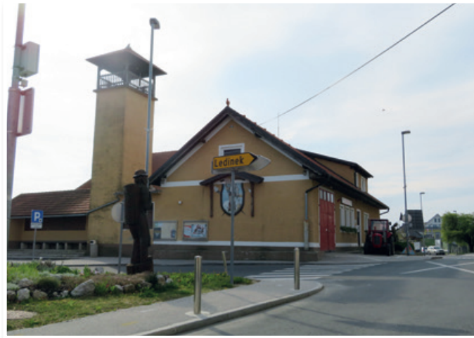
V Sveti Ani imajo defibrilator pri vhodu v gasilski dom.