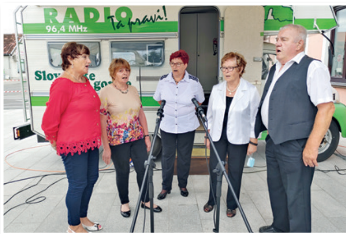
Pevci Društva upokojencev Cerkvjenjak