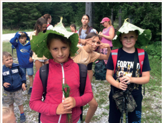
Otroške aktivnosti