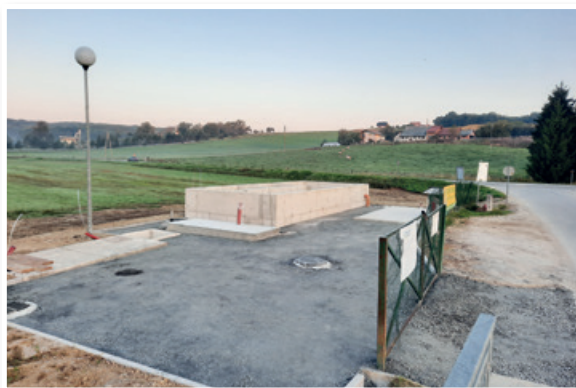
Gradnja Čistilne naprave Voličina

Dolgoročno izredno pomembna investicija je gradnja čistilne naprave za naselje Voličina.