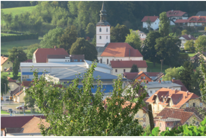
V Občini Benedikt so med drugim prenovili parket in zamenjali razsvetljavo v športni dvorani.

Kako pa je občini čez poletje uspelo uresničevati svoje načrte od obnove parketa in menjave svetilk v športni dvorani do izgradnje druge faze kanalizacije v naselju Sveti Trije Kralji. Katere investicije in