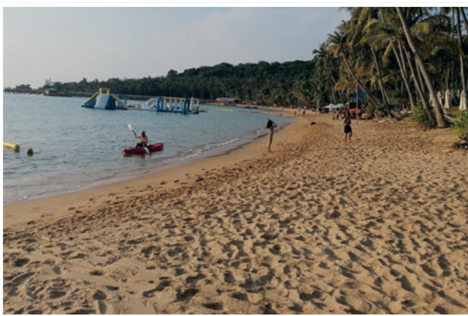
Plaža v Vietnamu