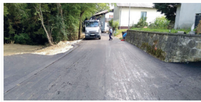
Asfaltiranje ceste v Zavrhu