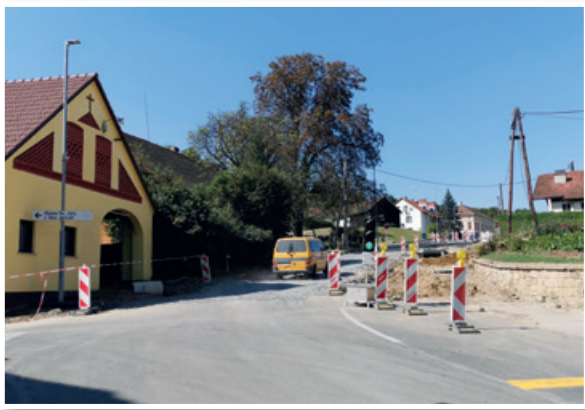
Dela na državni cesti v polnem teku