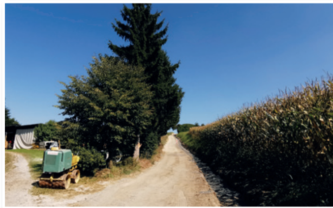
Zemeljska dela na cesti v Sp. Partinju

Gradbeno podjetje Kokol in Kokol iz Miklavža je pričelo z izvedbo dobrih 400 tisočakov težkega projekta, s 4. fazo rekonstrukcije občinskih cest v Občini Sv. Jurij v Slov. goricah. V minulem mesecu so pričeli z deli na prvem odseku v Sp. Partinju in sicer na relaciji Zamarkova-Partinje-Varda-Jurovski Dol (LC 203-131). Skupna dolžina rekonstrukcije omenjenega cestnega odseka (JP 705 061) znaša 650 m. Dosedanje makadamsko cestišče pa bo s treh metrov voznega pasu razširjeno na 4 metre novega asfaltiranega cestišča.