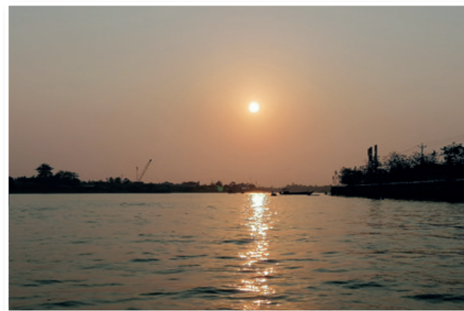
Sončni vzhod na reki Mekong

V naslednjih dneh sva obiskala še otok Phu Quoc, znan po številnih plažah in lepi naravi. Tam sva najela skuterje za nekaj dni, na vseh plažah pa sva preživela skupaj morda celo dve uri. Tu se je že malce slišalo o koroni, zato sva se tudi midva malce umirila – razen, ko je šlo za barantanje. Tako sva za petino zbila tudi ceno za najdaljšo pomorsko žičnico na svetu, ki je standardna na vseh uradnih prodajnih