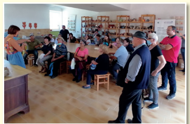
V rokodelskem centru DUO v Veržeju