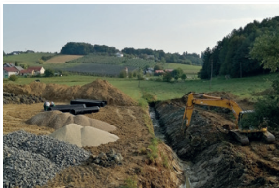
Gradnja Lokalnega namakalnega sistema Selce

Zaključena so gradbena dela, kmalu bo sledila montaža tehnoloških elementov za čiščenje odpadnih vod. V celoti bodo dela izvedena konec oktobra, poskusno obratovanje naprave se bo pričelo v začetku novembra.