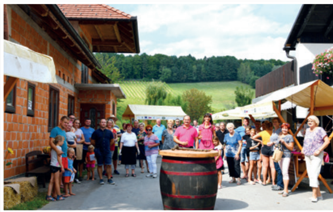
Dan odprtih vrat SLO kmetij - Hiša vin Kokol

gradov in nabavo sodobne tehnologije, kar se jim danes obrestuje. Prilagajajo se trgu, več tržijo na domu, sicer pa na tržnicah, sejmi in ob drugih priložnostih, kjer lahko program strankam bolj osebno predstavijo. Klasično vinogradništvo nadgrajujejo s predelavo grozdnih pešk, kar je dokaj novo v Sloveniji. Predelava zahteva mnogo truda in dela. Olje pridobivajo iz lastnih grozdnih pešk. Precej je ročnega dela, po izločitvi pešk le-te posušijo na soncu in dosušijo v sušilnici ter v stiskalnici po postopku hladnega stiskanja iz njih iztisnejo olje. Olje tako ohrani vse pomembne zdravilne sestavine.