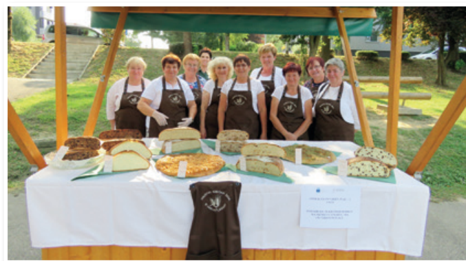
Članice Društva kmečkih žena in deklet Lenart

Izvedenih je bilo več programskih aktivnosti, delavnic in prireditev, kot so: Ovtarjeva trgata v Vrta Lenart, Dober kot kruh, Za pogrnjeno mizo - tradicionalne jedi v luči praznikov, Kulturne rastline in semena, vse v Vrta Lenart, Promocija turističnih kmetij in lokalne ponudbe na tržnici Lenartu, Ovtarjev plac vabi še druge.