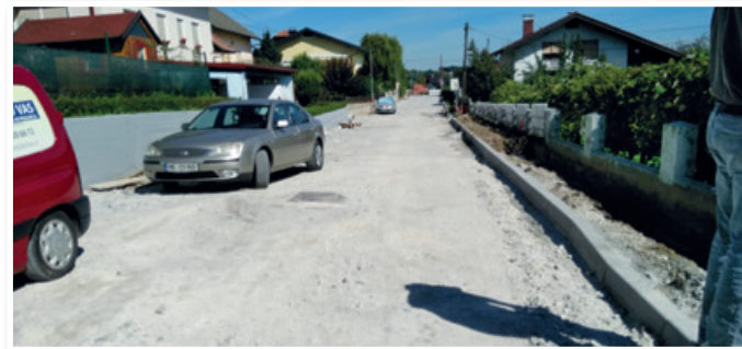
Dela v Prežihovi ulici, foto: Andrej Rojs